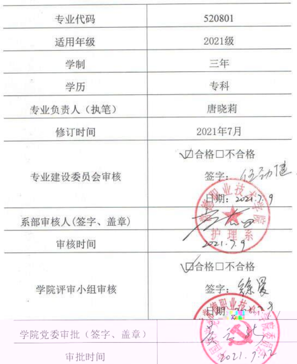
2021 级 健康管理 专业人才培养方案审批信息表

说明:本人才培养方案适用于统招、单招三年制大专。对退役军人、下岗职工、农民工、新型职业农民单独制定人才培养方案。校企合作班级在国家教学标准基础上可以增加企业特色课程,人才培养方案单独制定。