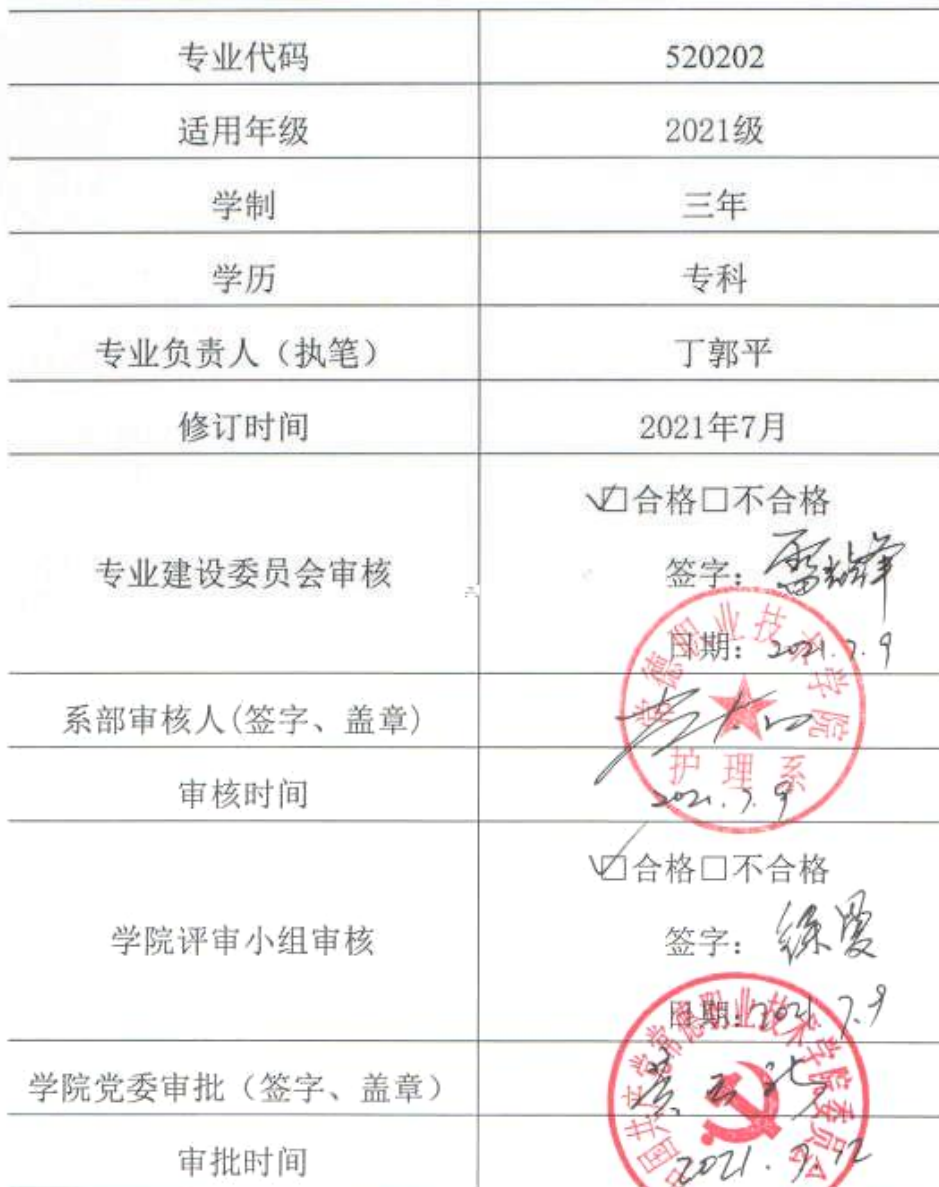
2021 级 助产 专业人才培养方案审批信息表

说明： 本人才培养方案适用于统招、单招三年制大专。对退役军人、下岗职工、农民工、新型职业农民单独制定人才培养方案。校企合作班级在国家教学标准基础上可以增加企业特色课程，人才培养方案单独制定。